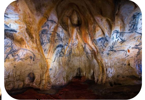
Grotte Chauvet France